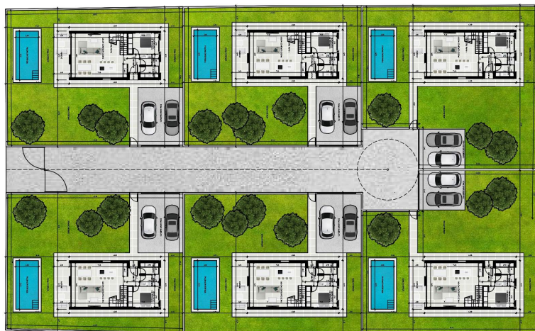
VIVIENDA 02 VIVIENDA 04 VIVIENDA 06